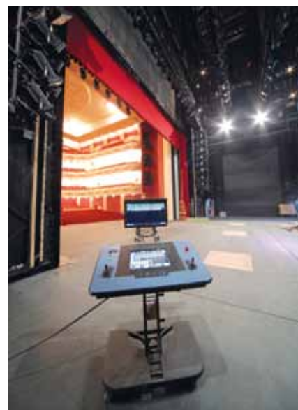
Пульт управления механикой

Основу комплекса нижней механики составили пять автоматизированных двухуровневых подъемно-опускных