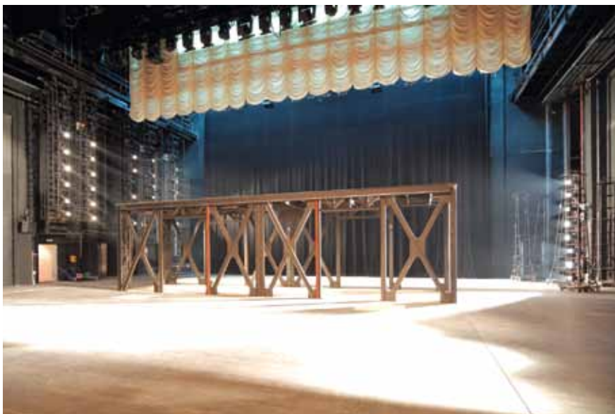
Подъемно-опускная площадка сцены

площадок. Их назначение – быстро менять ландшафт сцены в соответствии с потребностями конкретной постановки. Возможность распределения сценического действия в нескольких плоскостях особенно востребована в оперных спектаклях, а также в современных шоу.