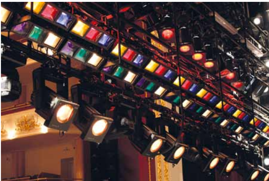
Один из семи софитов Самарской оперы

Обязательным атрибутом любой сцены, где ставятся балетные спектакли, являются перекатные осветительные башни. Их назначение – нести на себе приборы, необходимые для освещения ног танцующих. В то же время эти механизмы часто представляют собой определенную угрозу для безопасности актеров – выбегая из-за кулис, балерины рискуют удариться о металлические платформы этих башен. В Самарском театре перекатные башни снабжены